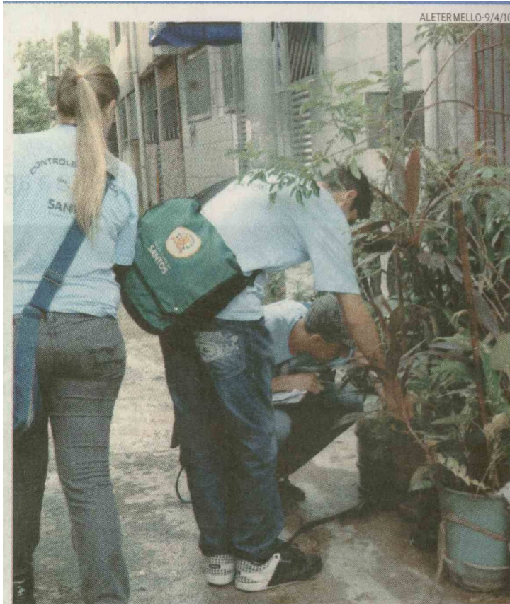
Os participantes dos mutirões estão eliminando focos do mosquito