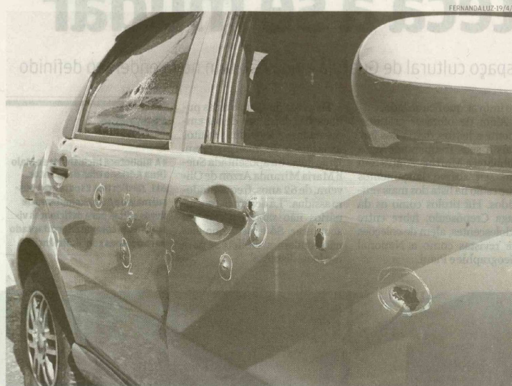
Policial que foi morto em abril teve o veículo em que estava, um Fiat Siena, perfurado por vários disparos